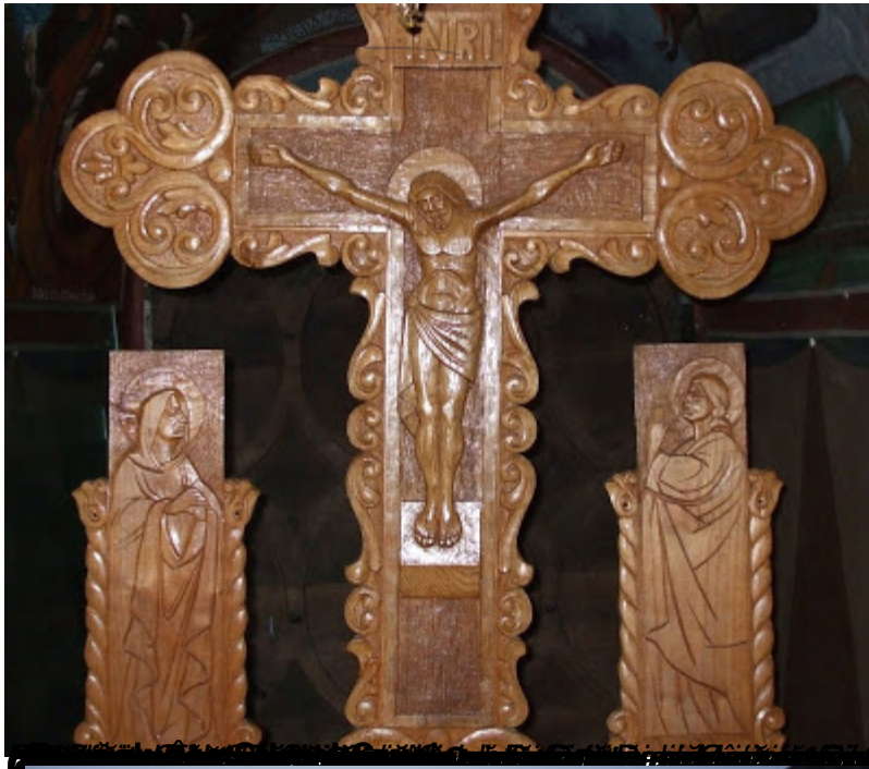
Fig. 16.14. Crucifixul din Gârbov