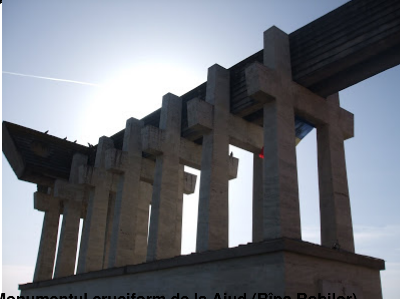
Monumentul cruciform de la Aiud (Ripa Robilor)