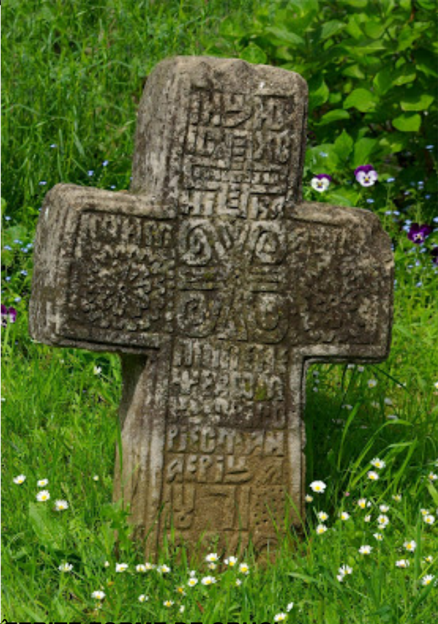
Forme de cruci din piatră în România, în acest caz este vorba de o cruce din secolul al IV-lea, din județul Giurgiu