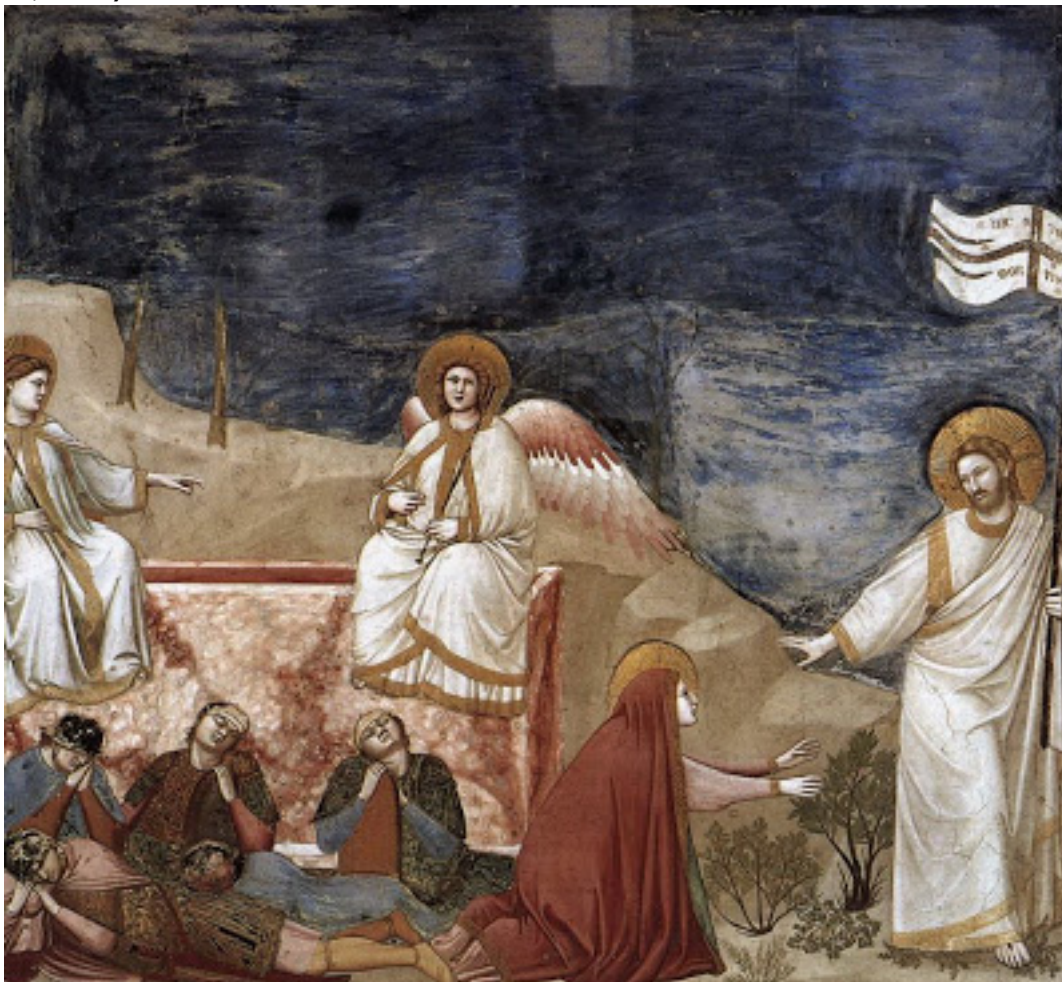
Giotto - Noli me tangere

Oare ce cuvînt nou le mai poate spune cineva tinerilor mei prieteni? Au trecut de atunci ani îndelungați. O nouă generație s-a ridicat, călită de o experiență unică și, poate, atinsă de un nou scepticism, născut din contactul cu lumea Occidentului rătăcită de la dreapta credință. Poate că astăzi, chiar mai mult decît atunci cînd am rostit eu cele "Șapte cuvinte..." [1978],