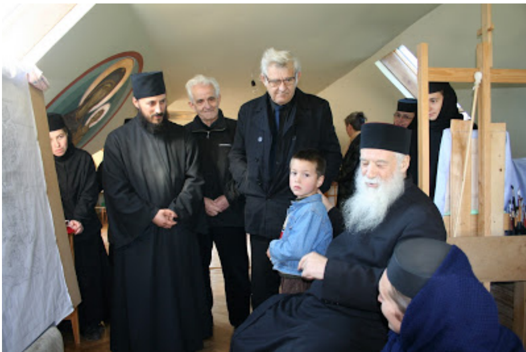
La Mănăstirea Diaconești, în toamna lui 2006 Se mai găsește încă în librării: