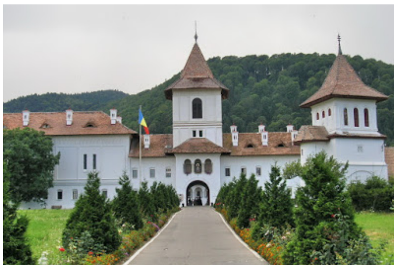
Mănăstirea Brîncoveanu de la Sîmbăta de Sus

Și cine altul l-ar fi putut defini pe Părintele Arsenie într-un stil mai succint și mai inconfundabil decît același Părinte Teofil, urmașul său duhovnicesc: „Cîndva stăteam în fața unei icoane făcute de Părintele Arsenie, la București, pentru mă-năs-tirea noastră, o icoană cu Adormirea Maicii Domnului... Stăteam în fața acestei icoane și o pre-zentam unui cadru universitar de la Sibiu, și zic: «Eu cred că Părintele Arsenie este un geniu». Și respectivul spune: «Asta înseamnă că are o cultură perfectă și încă ceva». Și zic eu: «Nu știu dacă are o cultură perfectă, dar sînt sigur că are încă ceva». Țsta a fost Părintele Arsenie...”