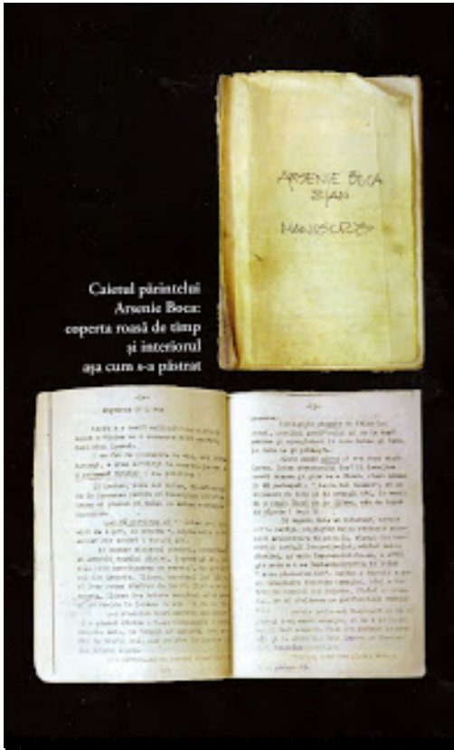
Calea părintelui Arsenie Boca: coperta roșie de timp și interiorul așa cum s-a păstrat